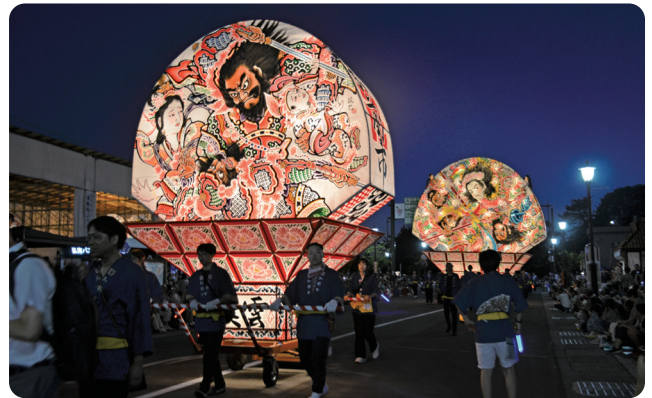
弘前ねぶたまつり 2025