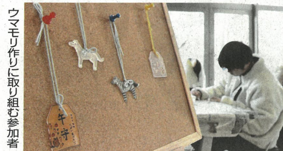
ウマモリ作りに取り組む参加者

今年、干支の午にちなみ、だお守り「ウマモリ」作りが、宇部市とときわ動物園体験学習館で行われている。プラスチック板を使ったオリジナルのお守りを作り、手に入れようと、多くの親子連れが訪れている。