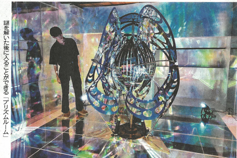
謎を解いた後に入ることが出来る「プリズムルーム」

いた。国の重要伝統的建造物群保存地区である柳井市の白壁の町並み一帯を舞台に、半年あまり前に始まった常設イベント「シークレットミュージアム」の1施設だ。