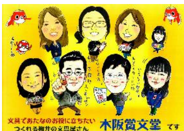
中央店スタッフの似顔絵です。

『市内だから歩いて行ける、市内なのに車で行ける』 20台駐車OK ですよ!ご来店お待ちしております。(木阪:記)