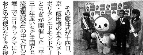
その就任式が十四日、東京・飯田橋のホテルメトロポリタンエドモントでJAとちぎが開催した「平成三十年産いちご王国とちぎ流通懇話会」の中で、壇上でコロニヤマモにちぎとちぎの代表が授与された(写真)。

「コロニヤ」が「びんちろひとみしり」をテーマに、パンとかわいらしいイラストがいっぱい入ったクロスマモなどの紙製品、美味しそうなパン