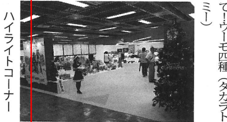
ハイライトコーナー

また、「プロが選んだ今年のクリスマスおもちゃ」の目撃品、重要商品を集中展示した「クリスマスハイライトコーナー」を展開。サンタクロース姿のスタッフが来場者を出迎えるなど一足早くクリスマススムードを演出した会場では、注目の新製品、重要商品を集中展示した「クリスマスハイライトコーナー」を展開。