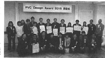
受賞者が記念撮影

【店舗概要】 山口県柳井市で柳井中央店、白壁店の2店舗を展開している専門店。JR柳井駅から徒歩5分の場所で営業している柳井中央店は、売場面積約100㎡で文具・事務用品をメインに、消しゴムはんこなどパーソナル色の強い商材にも力を入れている。加工サービスも各種対応していることも特徴で、「つくられる文具屋さん」のキャッチコピー通り、地元の需要に幅広く応えている。駐車場は20台。HPは http://www.sirakabe.com/