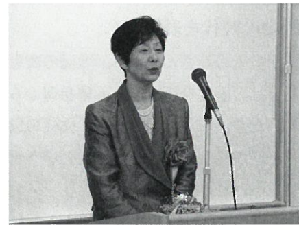
小河呉服店 (明治33年創業)