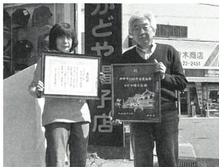
かどや帽子店 (明治45年創業)