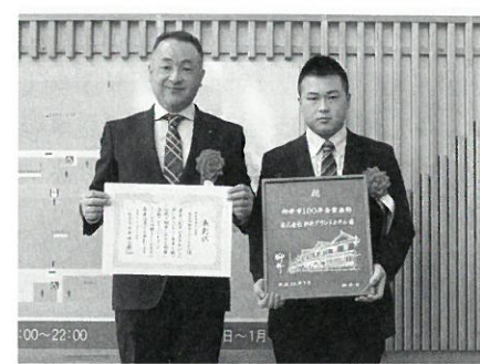
株式会社柳井グランドホテル (大正4年創業)