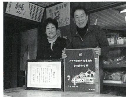
金田染物店 (明治40年創業)