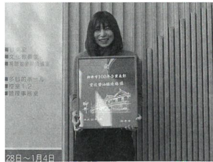
重枝醤油醸造場 (明治23年創業)