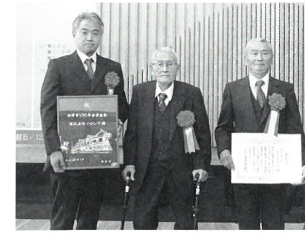
株式会社ヒロシゲ (明治41年創業)