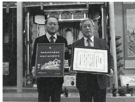
株式会社小林佛壇製作所 (明治11年創業)