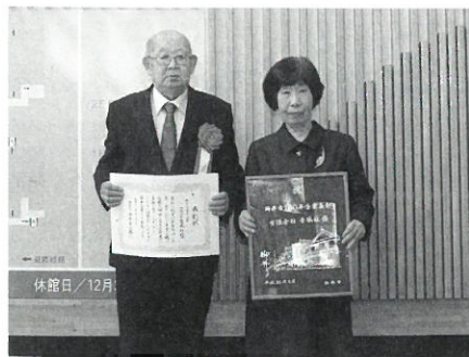
有限会社青風社(尾林呉服店) (江戸中期創業)