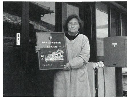
大空商店 (明治45年創業)