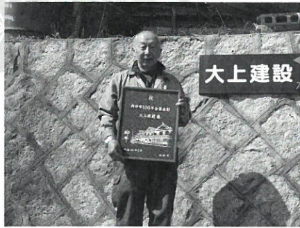
大上建設 (明治後期創業)