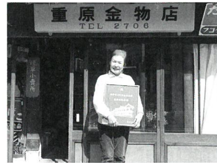
重原金物店 (明治30年創業)