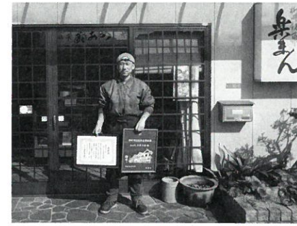
ひがしや菓子店 (弘化2年創業)