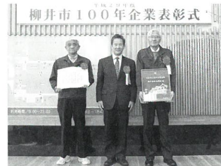
株式会社玉野井 (明治7年創業)