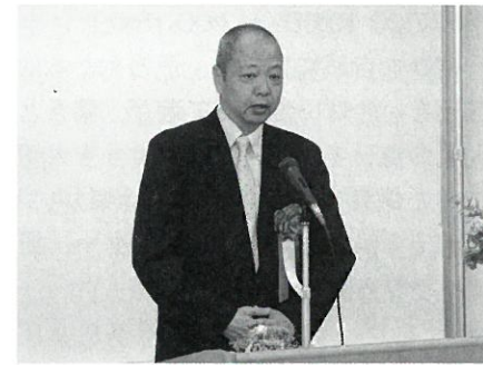
有限会社山中 (明治38年創業)