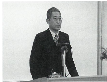
有限会社武居百貨店 (明治35年創業)