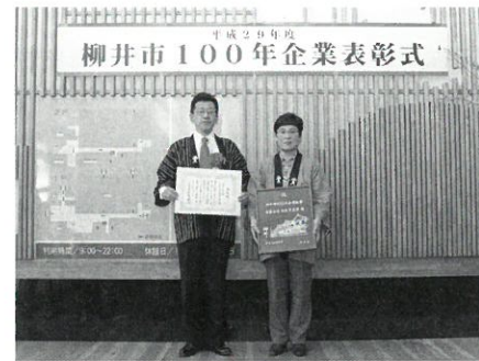
有限会社木阪賞文堂 (明治27年創業)