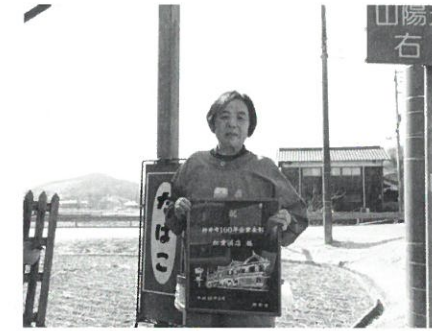
松重酒店 (明治元年創業)