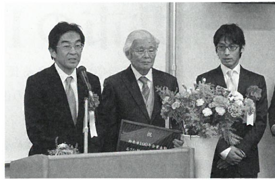
あさひ製菓株式会社(大正6年創業)