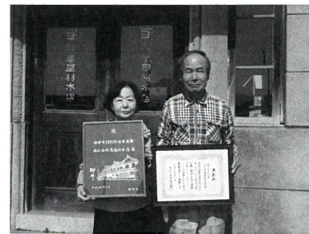
株式会社萬屋材木店 (宝永元年)