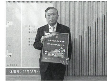
株式会社村岡時計店 (明治39年創業)