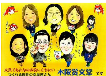
中央店スタッフの似顔絵です。

『市内だから歩いて行ける、市内なのに車でいける』20台駐車OKですよ!ご来店お待ちしております。(木阪:記)