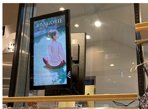
※この写真は店舗内イメージです。

れました。古い建屋であっても、常に新しいものを取り入れる気概は持ち続けたいと思い、白壁店にクラウド式のデジタルサイネージを設置することを決意した訳です。10月スタートを目指し、現在準備中ですが、日々の情報の収集や発信を通じて私達自身もアップデートされていく感じがドキドキです。只単なる商品やサービスだけでなく、柳井市や白壁の町並みの情報、金魚ちょうちんの由来等々を店内外でご案内出来たらと考えています。(記：木阪泰之)