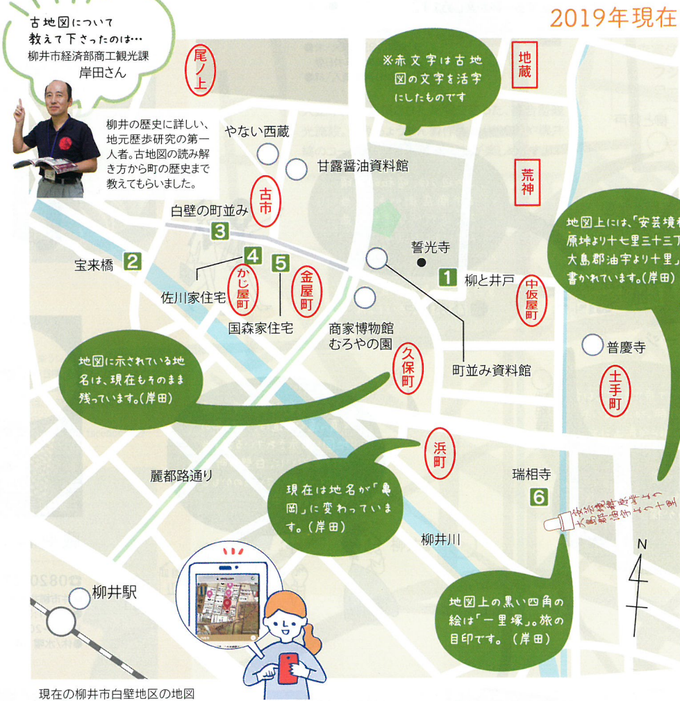
現在の柳井市白壁地区の地図

1199年に開基された古刹。お寺の中には閻魔十王堂があり、閻魔大王の像や珍しい奪衣婆像なども見どころです。