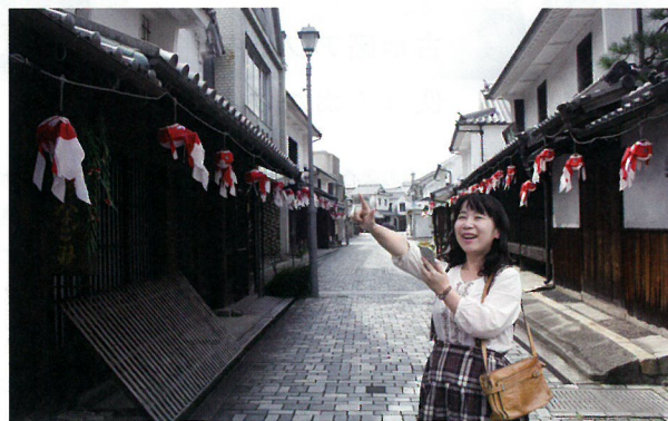
「古地図を片手に、まちを歩こう」のアプリを使えば、スマホで現在地と古地図を照らし合わせながら、まち歩きが楽しめます。

江戸時代の商家が残る町並みを、かつての姿を思い浮かべながら... 商人の町・柳井をそぞろ歩き