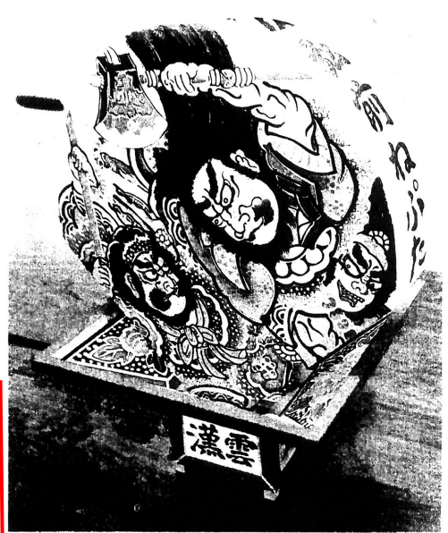
製作する弘前ねぶたのミニチュアサンプル

みまを歩くことができる大きなねぶたとし、向き合う建物の軒先の一番狭い部分の3メートル内に納まるように、扇幅約2・8メートル、高さ約3・4メートル。本体は木材で製作。本体を乗せる台車は、鉄骨でねぶたを乗せる台座と、軽自動車のタイヤと軸を使って車輪を作り移動できるようにする。ねぶたの顔となる絵は、ねぶた団体に依頼している絵師に描いてもらおうとしている。