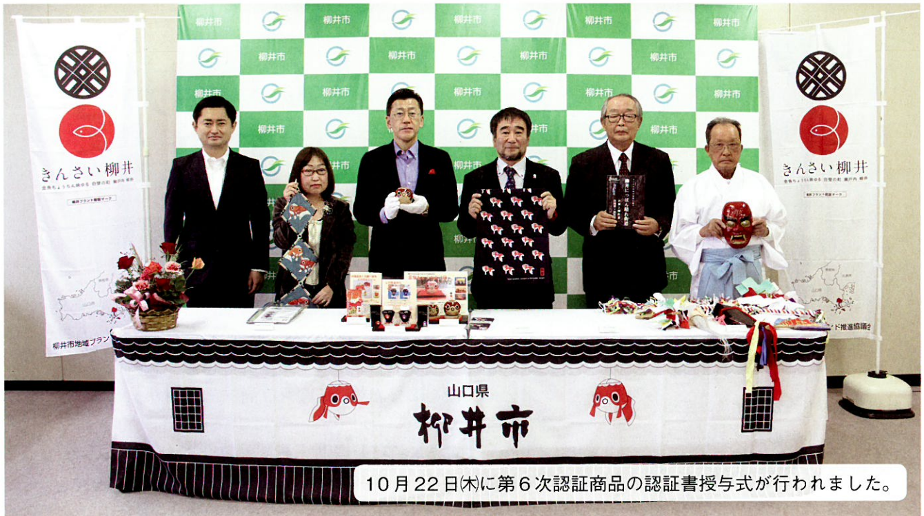
10月22日(木)に第6次認証商品の認証書授与式が行われました。

柳井市地域ブランド推進協議会では、柳井市の産業や歴史文化、自然など多分野において、特に優れたもの、真に価値あるものを、地域ブランド「きんさい柳井」として認証しています。