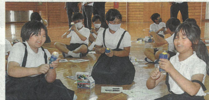
工作キットで発電の仕組みを