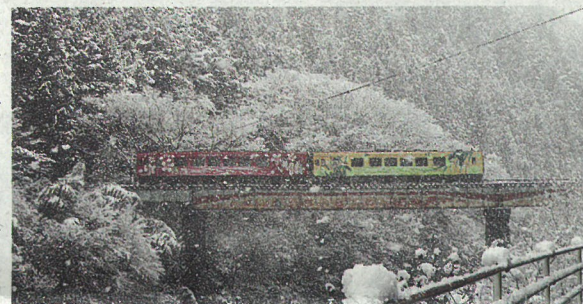
雪の錦川清流線を走る列車

学生以上7500円)か、川ガニ鍋(同6500円)のどちらかを食べる。清流の郷では猪鍋(同7千円)か山女御膳(同6千円)を選ぶ。いずれのコースも鉄道の往復料金と入浴料などがセットで小学生は千円引き。 2人以上で希望日の3日前までに申し込む。錦川鉄道 ☎0827(72)2002。