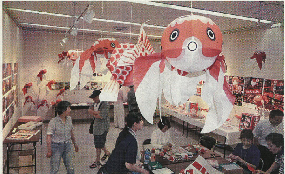
柳井市の代表的民芸品である金魚ちょうちんなどが並ぶ会場

二三夫理事長は「金魚ねぶたと縁のある民芸品が弘前から遠く離れた場所で誕生したことを、この機会に弘前の方々にも知ってもらえたら」と話した。3日まで。入場無料。(一戸崇矢)