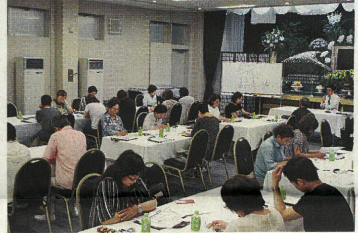
遺言について学んだ終活セミナー

か、毎年8月13日に柳井市で開かれる「金魚ちょうちん祭り」の写真、金魚ねぶたのモデルになったとされる金魚「津軽錦」を展示。また、今年金魚ちょうちん祭りは、金魚ねぶたを展示する予