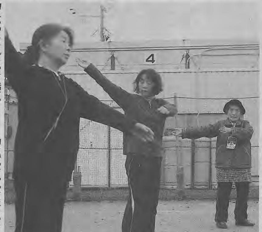
仮設住宅の運動場で体操する住民たち(陸前高田市竹駒町で)

同小の校庭に建てられた仮設住宅の脇に、幅100センチ、奥行き30センチほどの運動場がある。午前6時半になると住民たち十数人が「おはよう」と言葉を交わしながら集まってくる。「始めるよ」の声と共にストレッチから流れ出したのはラジオ体操の伴奏。住民たちは輪になり、空に向かって手を突き上げたり、屈伸をしたりして体を動かした。